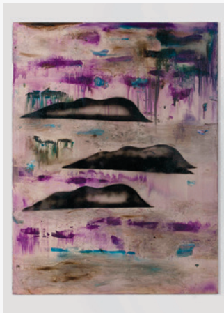
38. Peinture de nuages, 2014, huile sur toile, 65 x 50 cm. Collection particulière.