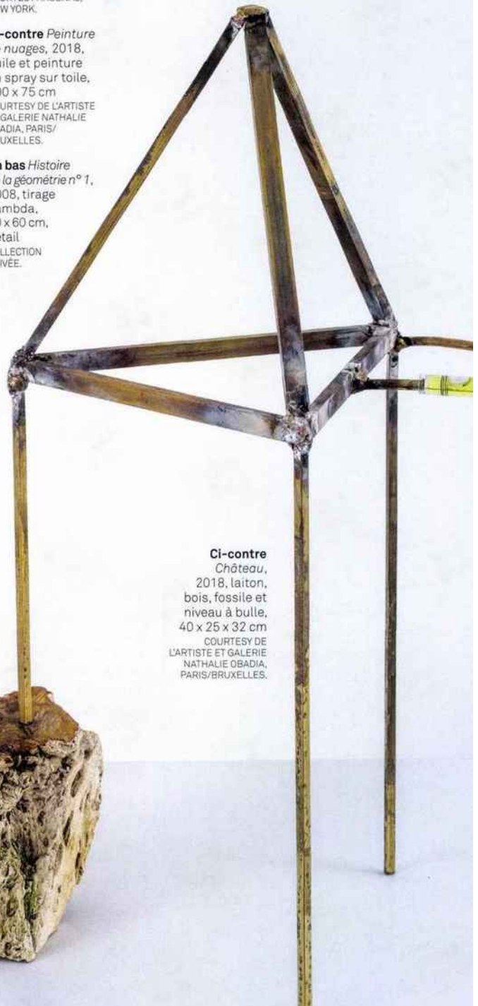
Ci-contre Château , 2018, laiton, bois, fossile et niveau à bulle, 40 x 25 x 32 cm

LE SITE INTERNET de l'artiste : www.benoitmaire.com